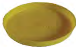
ถาดอาหารลูกไก่