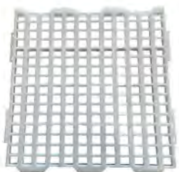
Slat BIT 50x50 cm