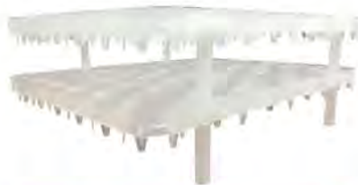
ถาดไข่ตู้ฟัก chick master 54 ฟอง