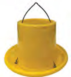
ถังอาหาร 10"