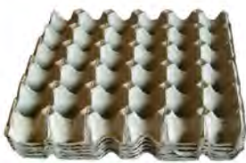
ถาดไข่กระดาษใหญ่