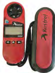
เครื่องวัดความเร็วลม