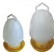
ขวดน้ำ 1 และ 2 แกลลอน