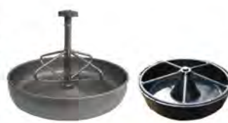
อ่างอาหารลูกสุกร