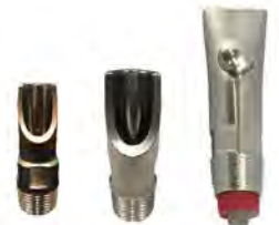
นippleให้น้ำสุกร