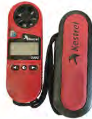
เครื่องวัดความเร็วลม