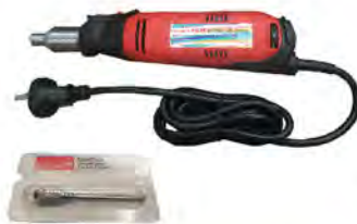
เครื่องกรอพื้นลูกสุกร