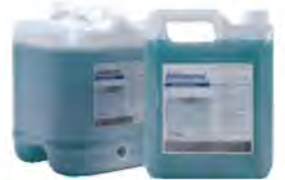
น้ำยาลดหินปูนหน้า PAD