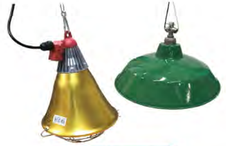
โคมหลอดกก

เป็นหลอดที่ให้ความร้อน แบบInfrared ซึ่งเป็นการแผ่รังสีที่ให้ความอบอุ่นเข้าไปถึงภายในตัวสัตว์ จึงมั่นใจได้ว่า สัตว์เลี้ยงจะได้รับความร้อนอย่างทั่วถึง โดยจะไม่เพิ่มอุณหภูมิให้กับบรรยากาศในฟาร์มเลี้ยงสัตว์ ซึ่งหลอดไฟนี้เป็นสินค้านำเข้าที่ได้มาตรฐาน จากประเทศเกาหลี โดยจะมีให้เลือก 3 ขนาด คือ 100W, 175W และ 250W ให้เลือกใช้ตามความเหมาะสม