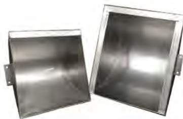
อ่างอาหารพ้อแม่พันธุ์ เล็ก-ใหญ่