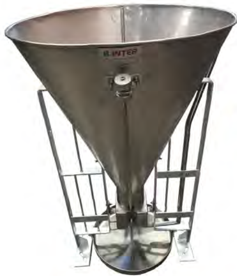
ถังอาหาร W&D สุกรขุน ทาดกาน