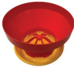
ถาดให้อาหารลูกไก่ทั้งอัตโนมัติ