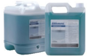
น้ำยาลดหินปูนหน้า PAD