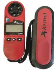
เครื่องวัดความเร็วลม