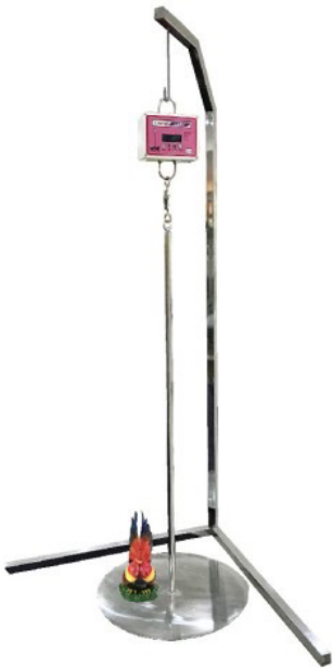
เครื่องชั่งไก่