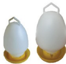
ขวดน้ำ 1 และ 2 แกลลอน