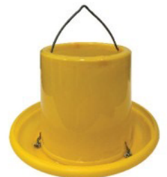
ถังอาหาร 10"