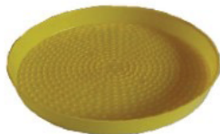
ถาดอาหารลูกไก่